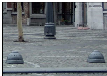
Potelets trop bas et d'une couleur non contrastée.