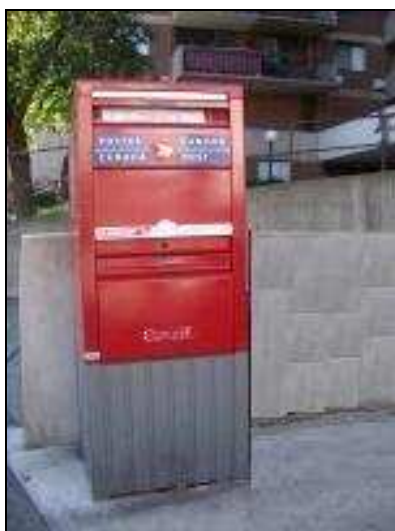
Prolonger l'obstacle jusqu'au sol.