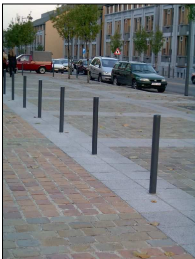
Potelets de couleur contrastée.