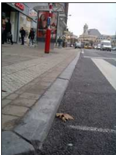
Traversée de plain-pied.