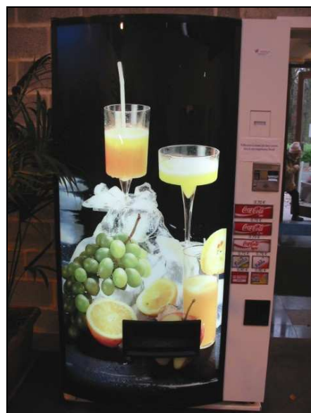
Touches de grande dimension, accessibilité du produit